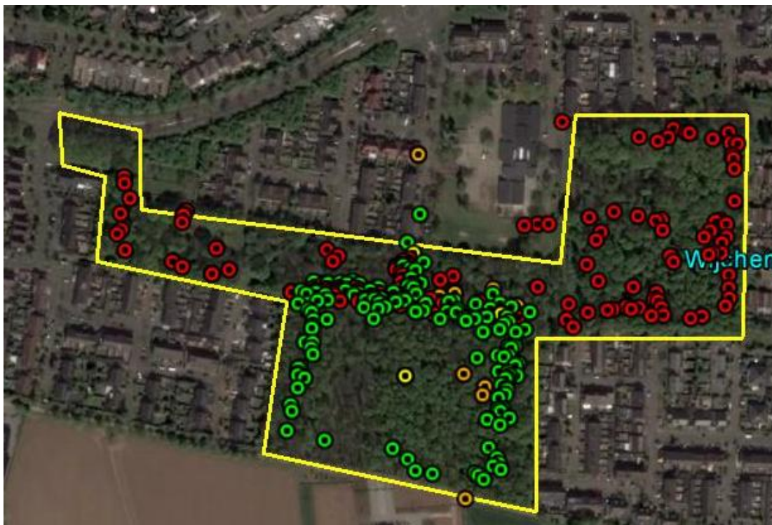
Figuur 3. Waarnemingen kleine wintervlinder Vormersbos 2014 (groen), 2015 (oranje), 2016 (rood). Niet elk jaar is in alle bosdelen gezocht (zie inleiding).