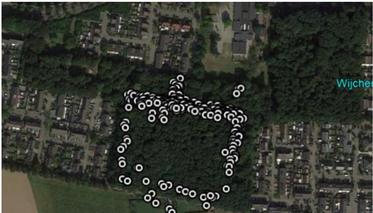
Figuur 2. Waarnemingen 2017. De locatie van de 6 zuidelijkste stippen klopt niet (GPS-verschuiving); de waarnemingen zijn op het pad in het Vormersbos gedaan.