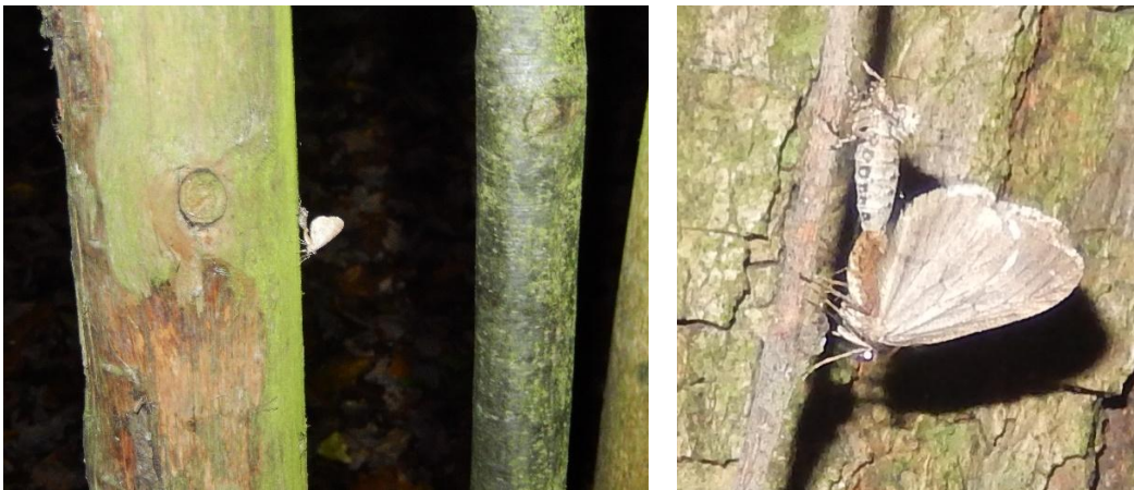
Figuur 1. Kleine wintervlinder (copula).

Van 2013 t/m 2016 telde ik in november en december op een fietsroute van Wijchen naar Nijmegen kleine wintervlinders (Hollander, 2013 t/m 2016). In 2013, 2014 en 2016 ben ik, op zoek naar kleine wintervlinders, met een zaklamp bomen afgegaan in een deel van het Vormersbos in Wijchen-Zuid. In 2017 heb ik de fietsroute niet meer gereden, maar de bomeninventarisatie in het Vormersbos geïntensiveerd. Naast kleine wintervlinders (figuur 1) zijn ook andere insecten op eikenbomen genoteerd. In dit verslag worden de resultaten van 2017 besproken en, voor zover mogelijk, vergeleken met de resultaten van de eerdere tellingen in het Vormersbos.